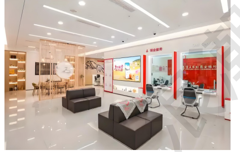
政务服务部门办事大厅

云璟一体机使用场景广泛，以其开机即用的产品特性，给客户带来便捷性的使用体验；即推即走的便捷移动特性，灵活方便，一台设备即可满足客户不同场景的使用需求；一体机集成化程度高，将控制系统、显示屏幕、音响功能集成于一体，免除了过多的设备，其无线投屏功能、稳定性、易操作性等很好的解决了用户的实用性需求。